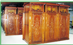
▲尊贵家族型金丝楠木福位