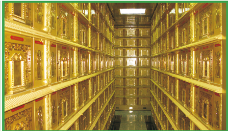
▲万佛园金宝塔精致的福位